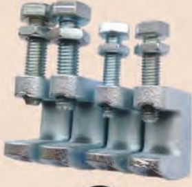
ODM 601 ASKI MENGENESİ | SUPPORT HANGER CLAMP Anma adı | Thread size M8-M10