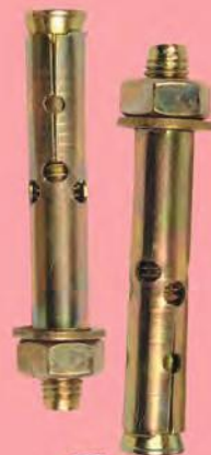
ODM 502 SAC SLEEVED GÖMLEKLİ DÜBEL ANCHOR

Anma adı Thread size M8x75-M10x90-M10x110 M10x120-M10x150-M12x90 M12x110-M12x150-M12x200 M16x110-M16x145-M16x180 M20x150-M20x180-M20x200