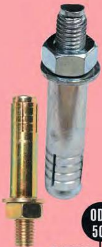
ODM 501 BORULU PİPED ÇELİK DÜBEL STEEL DOWEL

Zinc (Cr+3) Zinc (Cr+6) Oxide (black) Geomet Nickel Chrome