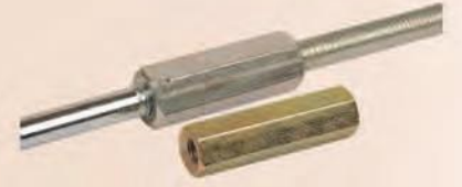
ODM 602 UZATMA SOMUN | LONG NUTS Anma adı | Thread size M6x40-M8x40 M10x40-M12x40 M16x40