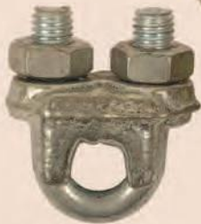
ODM 606 ÇELİK HALAT KLAMENSİ (A-TİP) | WIRE ROPE CLIPS Anma adı | Thread size 6-8-10-12-15-16-18-20 22-25-28-32-40-45-50