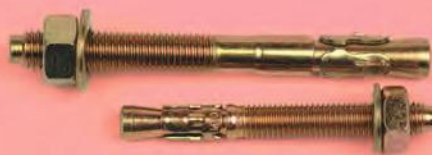
ODM 503 KLİPSLİ DÜBEL THROUGH ANCHOR BOLD

Anma adı Thread size M6x65-M8x60-M8x75-M8x110 M10x85-M10x110-M10x150 M12x90-M12x110-M12x150 M14x110-M16x120-M20x140