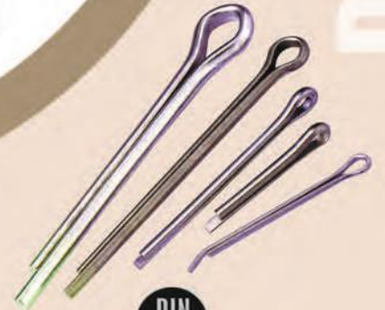
DIN 94 KOPİLYA | SPLIT PINS Anma adı | Thread size | Uzunluk (mm) Lenght 1,5-2-2,5-3-3,5 | 15-20-25-30-35 4-5-6-7-8-10 | 40-45-50-60-70 80-90-100-110-120