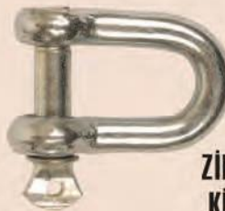
ODM 607 ZİNCİR KİLİDİ | SHACKLE, U-TYPE Anma adı | Thread size 6-8-10-12-16-20-22-25