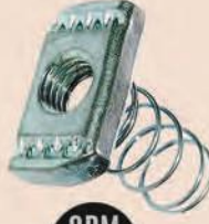
ODM 603 YAYLI SOMUN | SPRING NUTS Anma adı | Thread size M6-M8-M10-M12