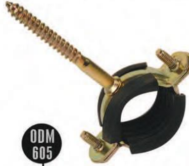
ODM 605 TRİFONLU DOĞALGAZ KELEPÇESİ | PIPE CLAMPS WITH SCREWS Anma adı | Thread size 1/2"-3/4"-1"-1 1/4"-1 1/2"-2"-2 1/2"-3"-4"