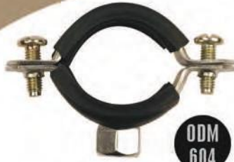
ODM 604 SOMUNLU DOĞALGAZ KELEPÇESİ | PIPE CLAMPS WITH NUTS Anma adı | Thread size 1/2"-3/4"-1"-1 1/4"-1 1/2"-2"-2 1/2"-3"-4"-5"-6"-8"-10"